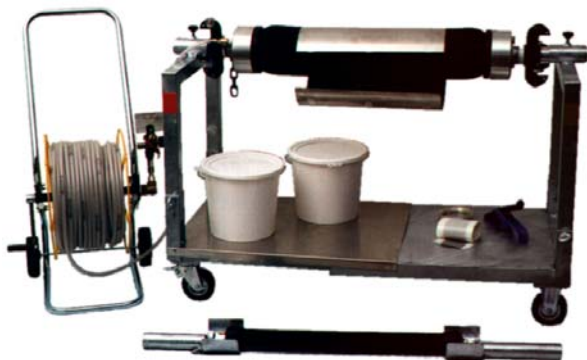
Attrezzatura di lavoro e di montaggio RIVA

Questo sistema di riparazione facilita una ampia gamma di utilizzazione: tubazioni rotte o con fessure, fratture, buchi o sezioni danneggiate per radici. La riparazione è effettuata rapida, solida e durevole.